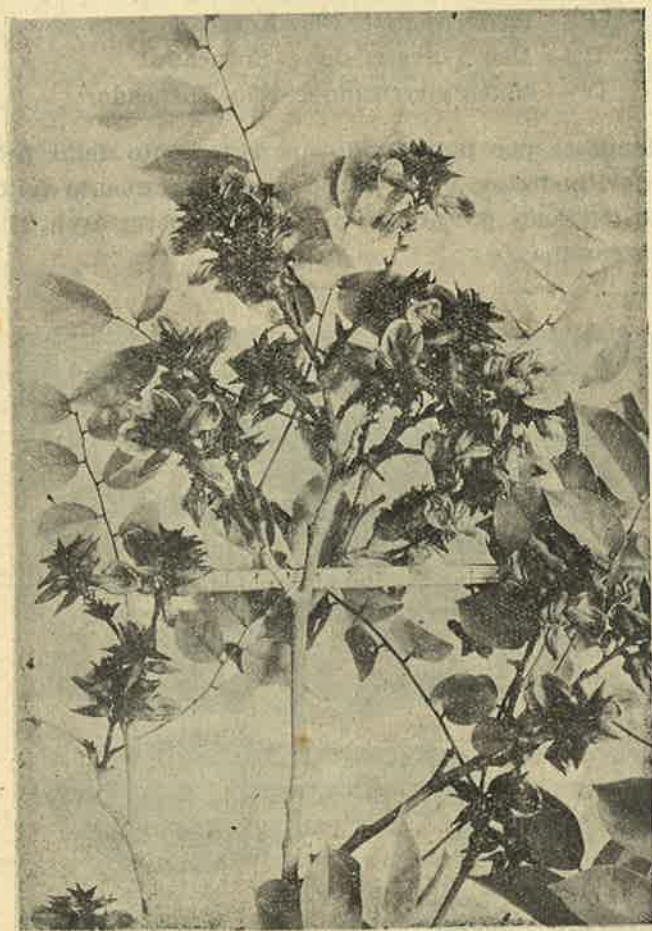
Fig. I — Aspecto pormenorizado da árvore, em plena floração.

Não tendo à época (a floração já estava começada) hormônios sintéticos à mão para um tratamento adequado, e em razão de observações com a floração da batata doce (3), usou-se o Rhodiatox na concentração de 10 gr. para 10 litros de água.