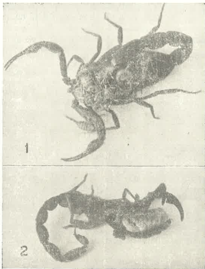
Fig. 1 — Fêmea de T. bahiensis com sua ninhada e um filhote “adotado”. Este já se encontra num estágio mais adiantado (após a primeira ecdise)