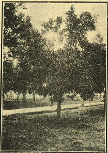
Photographia n. 2 — Tangerina Cravo com excesso de carga. Em 23-4-931. E. A. S. L. Q.

CORTE E ENTERRAMENTO — Em 16 de Abril (um pouco tarde; poder-se-á fazel-o um mez antes), foi feito o corte deixando côtos de 10