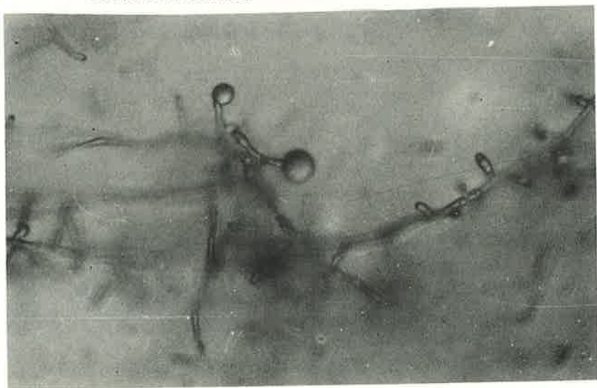
FIGURA 3. Isolado n.º 9. Corpos globosos (knobs adhesivos) formados em presença de larvas do nematóide Rotylenchulus reniformis (320 X).